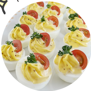
スタッフドエッグ