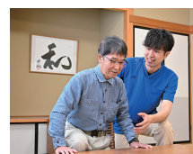
自分の力で立ち上がる練習