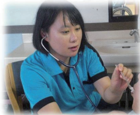
言葉や飲み込みのスペシャリスト！