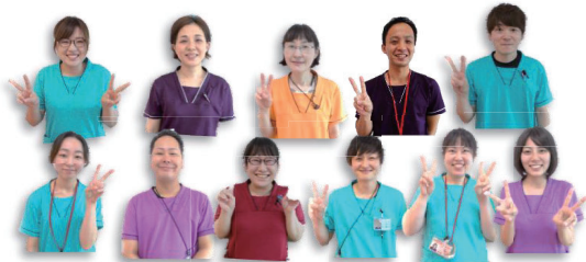
総勢 16 名のリハスタッフが在籍 (R2.11 現在)