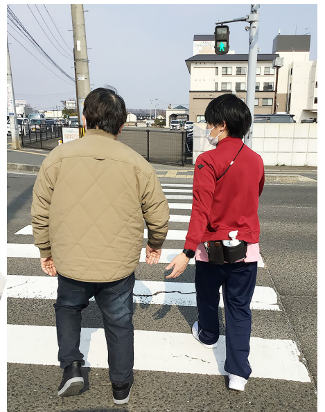
不安な場面も職員と一緒に！