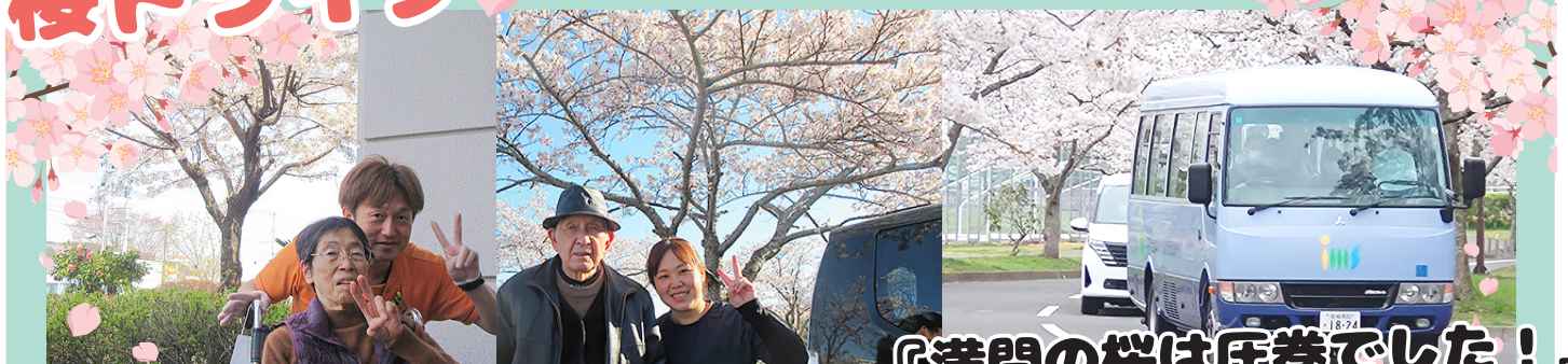
『満開の桜は圧巻でした！』