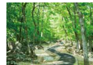
不動尊公園キャンプ場

豊かな自然の中にあるキャンプ場。中央に流れる川では水遊びも楽しめます。水音や星空を感じながらリフレッシュ。